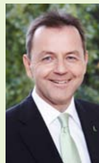
Landwirtschafts- und Umweltminister Niki Berlakovich

Gesunde Raumluf hat großen Einfluss auf unsere Lebensqualität, da wir uns überwiegend in Innenräumen aufhalten. Damit wir in den eigenen vier Wänden befreit aufatmen können, ist es wichtig, über Schadstoffe und ihre Ursachen Bescheid zu wissen, damit sie rasch erkannt und reduziert oder vermieden werden können. Gute Atemluft kann man zwar nicht sehen – aber (wohl)fühlen!