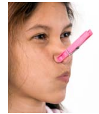
Schlechte Gerüche können die Ursache von Befindlichkeitsstörungen wie Kopfschmerzen oder Übelkeit sein.

Die meisten Gerüche haben in Innenräumen nichts verloren. Gesunde Raumluft benötigt auch keine „Verbesserung“ durch Orangenduft und Räucherstäbchen. Halten unangenehme Gerüche länger an, suchen Sie mit Hausverstand und professioneller Hilfe die Ursache und entfernen Sie diese.