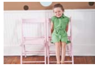
Vollholzmöbel haben eine lange Lebensdauer und geben keinen Formaldehyd ab.