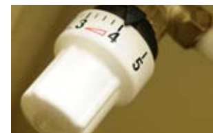
Bitte nicht zu warm! Überheizte Wohnungen können sogar gesundheitliche Folgen haben.