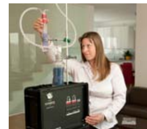
Professionelle Schadstoffmessungen geben Auskunft über die Konzentration von Schimmelpilzsporen in Ihrer Wohnung.

Diese Feuchtigkeit – an Wänden, Fensterstöcken oder Möbeln – entsteht oft durch Kondensation der Luftfeuchtigkeit oder aus dem Untergrund aufsteigende Feuchte. Häufige Ursachen für mikrobiellen Befall sind schlechte Belüftung oder fehlende Wärmedämmung. Die von Schimmelpilzen abgegebenen Sporen können mitunter auch Giftstoffe