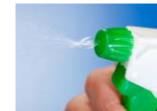
Vorsicht bei der Bekämpfung von Schimmelpilzbefall mit scharfen Chemikalien – diese sind oft selbst gesundheitsgefährdend!