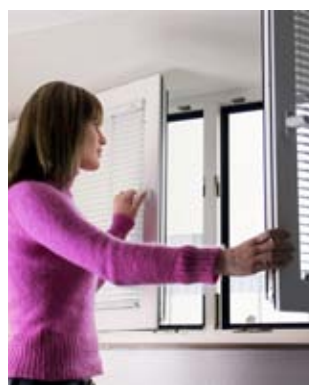
Regelmäßiges Stoßlüften ist besser als dauernd gekippte Fenster.

Richtiges Lüften hilft, für Wohlbefinden und Gesundheit zu sorgen. Es kann rechtzeitig verhindern, dass sich Luftverunreinigungen in Ihren Räumen ansammeln. In modernen Wohngebäuden gelten Komfortlüftungsanlagen als Standard. Diese vereinen die Zufuhr frischer Luft mit Wohlbehagen.